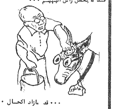
قد ما يتمثل رأس البيهيم