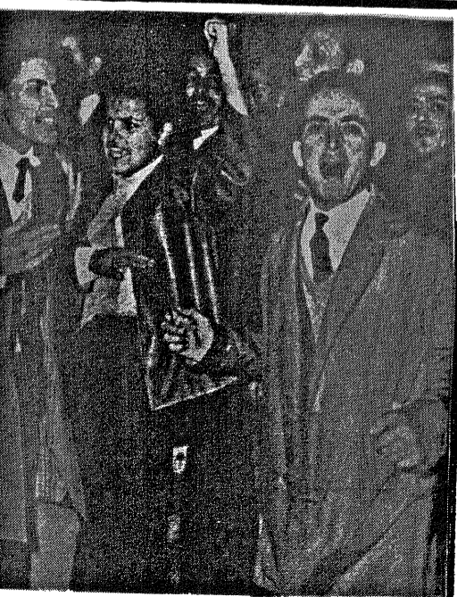
العمال الاجانب في فرنسا يتظاهرو باش يحتجوا ضد العنصرية