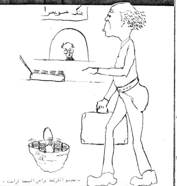
تحيبو القرمة فراهي البسة قرامت .