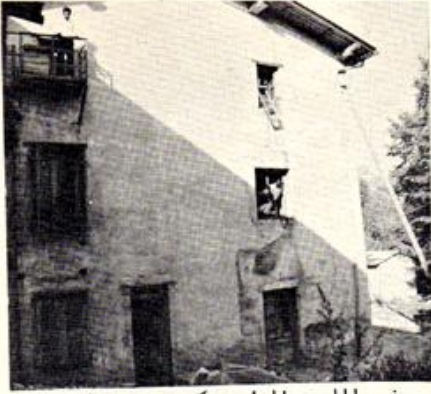
في ها البنية الحاربه مكسين ٢٠ خدام

النتابه اللي بيوز للرجوع للخدمه تمام ها الوضيه العمال المضربين نزلو بعد ٢٨ يوم اضراب الرجوع للخدمه وفي قلبهم تحتره و نار و جند على البطارن و الحوكه بانواعهم الكل .