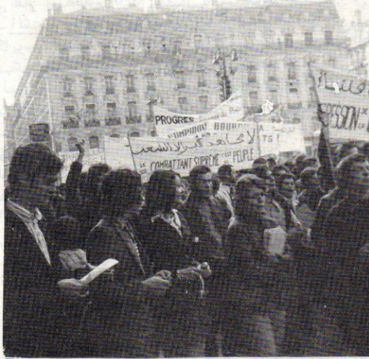
مشهد من نضالات العمال في الهجره

الحكومة التونسية تتحمل مسؤولية كبيرة في الحالة التعيسه التي يعيش فيها المهاجرين التونسيه المسؤولينه لولئى ترجع لعجز الحكام على تطوير اقتصاد البلاد الشبي التي كثر البطاله وكثر اولادنا للهجره . والمسؤوليه الثانيه هي اتو الحكومه التونسيه في عوض تدافع على حقوق المهاجرين حاولت بالعكس تكسر لهم نضالهم كيف ما تعمل في تونس .