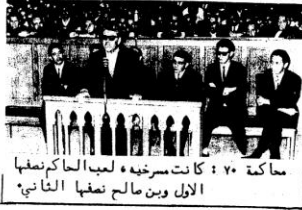
محكمة ٧٠ : كانت سرخيه لعب الحاكم منها الأول و بن صالح نصفا الثاني