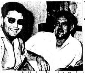
عام ٥١: عاجور تامر على التجابه و بين صالح تامل و تفسر