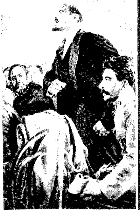
قائدا البروليتاريا العالميه : الرفيق لينين يخطب في اجتماع عمومي و بجنبو الرفيق ستالين

من اعظم الحوادث التاريخيه التي تسهم الطبقة الشغيلة ثمة ثورة اكتوبر التي وقعت في عام ١٩١٧ في روسيا . لا اول مره في تاريخ روسيا و تاريخ العالم تاخذ فيه الطبقة الشغيلة و الشعب الحكم و لا اول مره في تاريخ الشعوب تسود البلاد الديمقراطييه و الحريه و بقيادة العمال و الفلاحين تسير البلاد اقتصاديا و سياسيا في صالح الشعب و بمساهمة الشعب . و كانسو العمال و الفلاحين منظمين في مجلس السوفيات التي هو كان عباره عن مجلس تنفيذي و تشريعي منتخب من طرف العمال و الفلاحين في ما نمهم و حقولهم ، و لا اول مره في تاريخ روسيا و العالم كمو رؤوس الاموال ما عاشر عندهم الحق في الكلام . و كانت ثورة اكتوبر تحقيق اللي كان حلم للطبقة الشغيلة و اللي ماتو من اجسو كثير من العمال في كافة انحاء العالم . و تخلق مجتمع جديد فيه الديمقراطيةيه و توفير الشغل لكل العمال و ضمانه المستقبل لكل عنصر من عناصر الشعب ، و لا اول مره في تاريخ روسيا و لآت البلاد تقدر تعيش و تطور الاقتصاد من غير رسالين و بالاستغناء عنهم . حينئذ كانت ثورة اكتوبر ثورة شعبيه و على راسها الطبقة الشغيلة الروسيه اللسي كان يقود فيها الحزب البلشفي الذي هو حزب العمال و اللي كان بلا بتو الفولاديه و تعلقو بالمبادئ ، و بثيقو في الجماهير نجم يقود الطبقة الشغيلة و الشعب الروسي