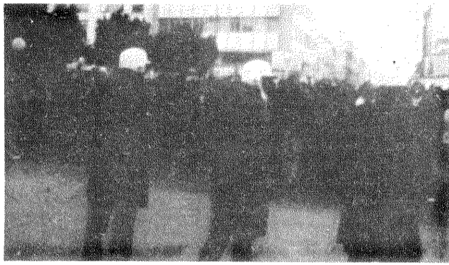
عداوة الشعب التونسي للامبريالية الامريكية اللي يدافع عليها بورقيبة تظهر في الصورة هذي اللي تمثل مظاهرات جرات في تونس ضد جيان وزير خارجيه امريكا السابق " روجرس " في فيفري ١٩٧٠ ( المكان : قدام قهوة تونس بالعاصمه )

و الشعوب العربيه و يعاون في أعدائهم و يخرب في كفاحهم ضد الاستغلال و القهر الامبريالي الصهيوني ه بورقيبة ما كفاهو يصرح بها المواقف العميله زاد قال اللي هو عازم على القيام بدعايه كبيره لتحقيق السلام في المنطقه على اساس لائحة الامم المتحده متاع عام ١٩٤٧ ه يعني على اساس الاعتراف بدولته اسرايل من طرف البلدان العربي و قبول فكان ٥٤ ٪ من اراضي فلسطين ه هذا هو