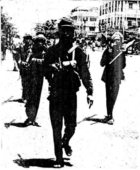
جيش التحرير الكيمودي المظفر يدخل العاصمة بنوم بينه