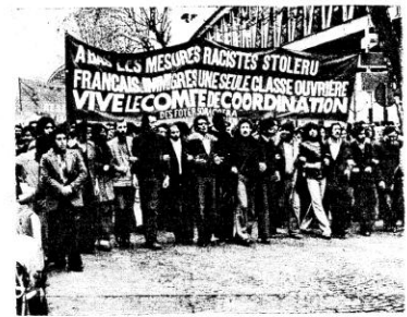
سوا امام السّلط الفرنسية او اللط التونسية

والى جانب تنظيمنا وسط النقابات الفرنسية مع بقية العمال الفرنسيين والمهاجرين الآخرين الذين يجمعنا معهم نضال واحد ضد نغزالإغراء ، لا بد أن ننظّم بصفة مسوّلة كونستيتن في منطقتنا طائفة تونسية جماهيرية لحلّ مشاكلنا في الهجرة وكذلك مشاكلنا المرتبطة بعقدتنا للوطن والدفاع عن حقوقنا