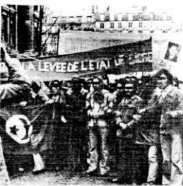
مظاهرات الحاشين التوسيين الذين انقلبوا التوسية بباريس