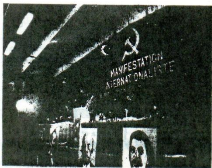
الرفيق امي نزيهين حزم امي . ومثلي الحزاب والمنظمات الشيوعية لم لم ومثلي حركات التحرر الوطني في اعلى الحصة وهم يبعثوا تحية للمهرجان .

الاممية البروليتاريا . ونحن اليوم و منذ عصور تقوم بتفهم تقدم و نقد ذاتي لتحريرنا و لثورتنا السياسي . لقد تحلنا عامة من الانباء التوفيق مع الانتفاضة و نحن اليوم في مرحلة تطور ايجابي و تدريجي . (000)