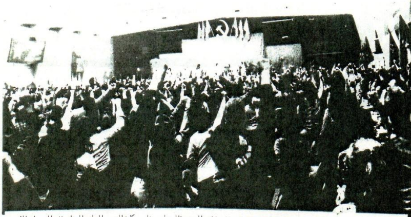
جمهور العمال الثوريين التي جانب الثوريين يحبون مثلي الخراب والشتمات الشيوعية لم لم ومثلي حركات التحرر الوطني الصامته في المهرجان الأمي

انتقد بيوتريال - عامدة الكندا - ابتداء من يوم 28 افريل الي يوم 9 ماي المنبر المستوسر الرابع للحارق للمادة للحزب الشيوعي الماركسي الليبنيني الكندي . وقد توفقت هذا المؤتمر يومى 30 افريل و امي حيث ترك المجال للمهروان الاسي المنظم من طرف نفسا الحزب وينفس المدينة والتي حضره عدد كبير من الحزاب والمنظمات الشيوعية الماركسية الليبنينية ومنظمات لتحرير الوطني من جسيه الفارات ما عدا اسرائيليا . وقد تم الاحتفال بهذا المهرجان الامي المهيوب وني من العمال الثوريين عند كبير من العمال من كل انحاء الكندا وكذلك من الولايات المتحدة الأمريكية .