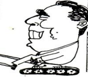
ان صدقة برجنيف هي حق صدقة سمومة

يقومون بظلمها مع صابة "بارك" المحملة في كوربا الجنوبية - تقي اقل خطورة من الدم القوي الذي ياتي لاسرائيل في شكل الهجرة اليهودية السوفياتية . نفي السنة اشهر الاولى من هذه السنة هاجر حوالي 5742 يهودي الى دولة الصهاينة التي هي في حاجة ملحة لمن يستلج حمل السلاح وهكذا يبلغ عدد الصهاينة الروس الذين استقروا منذ 1970 في اسرائيل 130 000 .