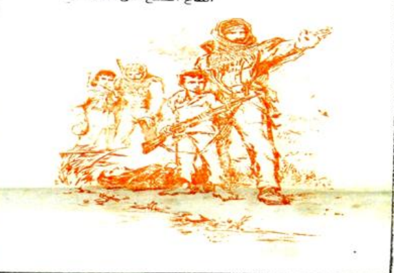
القائمة الفلسطينية تهربا الطريق : الكفاح المسلح حتى النصر*

ان ما قيل في هذه القطة عن شجورة التحالف مع الاميراليين الروس الخطر مثال صدقة برجنيف السمومة ونبروة اعتبارهم حلفاء* استراتيجيين ( )