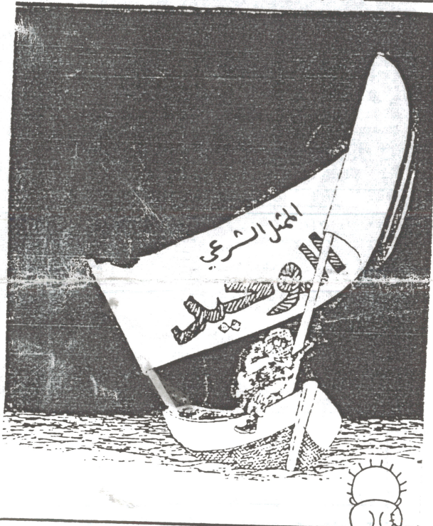
L'Unique représentant légitime